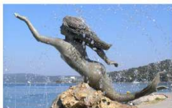
Έργο: Γ. Ξενούλη

Ονειρευόταν την μικρή γοργόνα και ήθελε να μπορούσε, όπως εκείνη, να βουτάει μέσα στα κύματα, να γνωρίσει τη ζωή στο βυθό της θάλασσας, να παρατηρεί τα πολύχρωμα ψάρια και τελικά να βρει τα ζώα των οποίων τα απαλά κελύφη και ελικοειδή περιβλήματα αναπαύονταν μέσα στα μεγάλα κιβώτια των διακοπών της Βαλτικής.